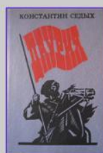
Седых К. Даурья