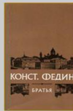
Федин К. Братья