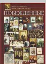
Головкина И. Побежденные.