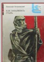
Островский Н. Как закалялась сталь.

Тема революции и гражданской войны надолго стала одной из главных тем русской литературы XX века. Октябрьская революция по-разному была воспринята деятелями культуры и искусства. Для многих она была величайшим событием века. Для других — и среди них оказалась значительная часть старой интеллигенции — большевистский переворот был трагедией, ведущей к гибели России. Одно было ясно - к старой жизни нет возврата. Отечественные писатели, отразившие в своих произведениях события 1918—1920 годов, создали ряд жизненных, реалистичных и ярких образов, поставив в центр повествования судьбу Человека и показав влияние войны на его жизнь, внутренний мир, шкалу норм и ценностей.