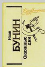
Бунин И. Окаянные дни