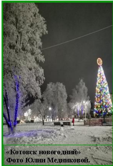
«Котовск новогодний»

Краткий пересказ рассказа. http://chitatelskiy-dnevnik.ru/