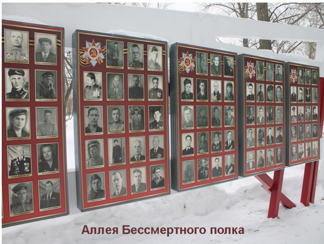
Аллея Бессмертного полка