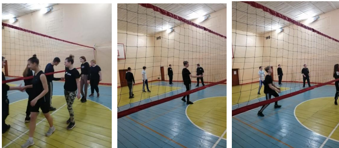
Учеба волонтерского отряда

С 12 по 26 апреля 2021 г. (3 этап – с 21 по 26 апреля) комиссией физвоспитания было проведено первенство техникума по волейболу. В соревнованиях приняли участие студенты 1-3 курсов. В упорной борьбе среди юношей победу одержала команда группы Э-И-1, у девушек – Бух-И-7. На втором курсе I место за группой П-П-2, у девушек – Тм-П-5. На третьем курсе победителем стала сборная команда групп Тм-Ш-5 и Пр-Ш-4. Участники первенства продемонстрировали свои спортивные достижения, сплоченность и командный дух.